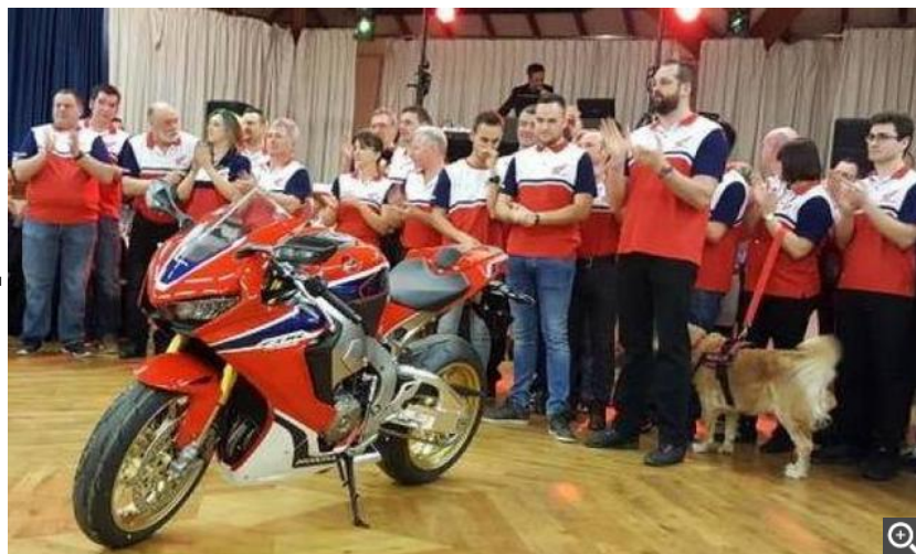
Le RAC 41 réuni autour de sa Honda CBR 1000.